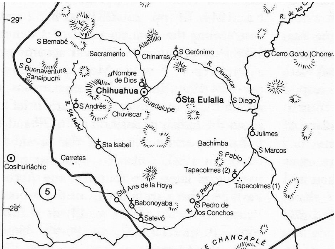
Map of the Villa de Chihuahua and surrounding area, Nueva Vizcaya (The North Frontier of New Spain, Peter Gerhard, page 196)